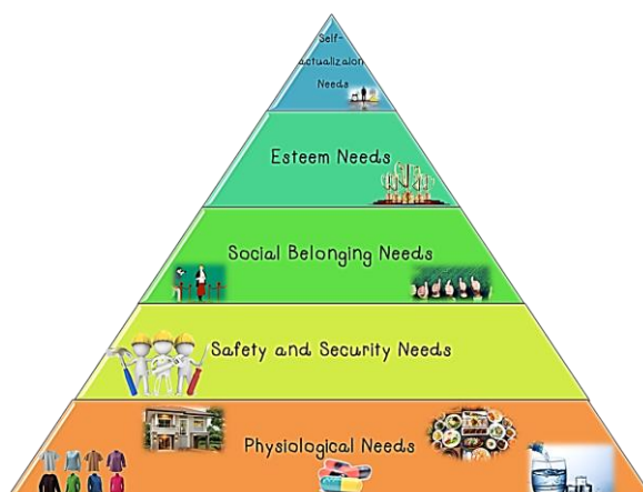
ภาพที่ 2.2 ทฤษฎีลำดับขั้นความต้องการของมนุษย์

Abraham H. Maslow เป็นนักจิตวิทยาและนักมานุษยวิทยา นำประสบการณ์ที่ได้รับจากการประกอบอาชีพและผู้ที่คำปรึกษา มาเป็นพื้นฐานในการนำเสนอทฤษฎี โดยอธิบายถึงพฤติกรรมของมนุษย์ว่ามีความต้องการเป็นลำดับแรก มนุษย์เปรียบเสมือนสัตว์สังคมที่มีความต้องการอย่างไม่มีที่สิ้นสุด จะมีความต้องการตลอดเวลาและมากขึ้นเรื่อย ๆ ซึ่งมนุษย์แต่ละคนจะเกิดความ ต้องการ ขึ้นอยู่กับสิ่งที่เขาได้รับหรือมีอยู่แล้ว เมื่อความต้องการอย่างใดอย่างหนึ่งได้รับการตอบสนองแล้ว ความต้องการด้านอื่น ๆ จะเกิดขึ้นแทนที่ กระบวนการลักษณะนี้จะเกิดขึ้นต่อเนื่องอย่างไม่สิ้นสุด ความต้องการจึงเป็นไปตามลำดับขั้น 5 ขั้นดังภาพที่ 2.1