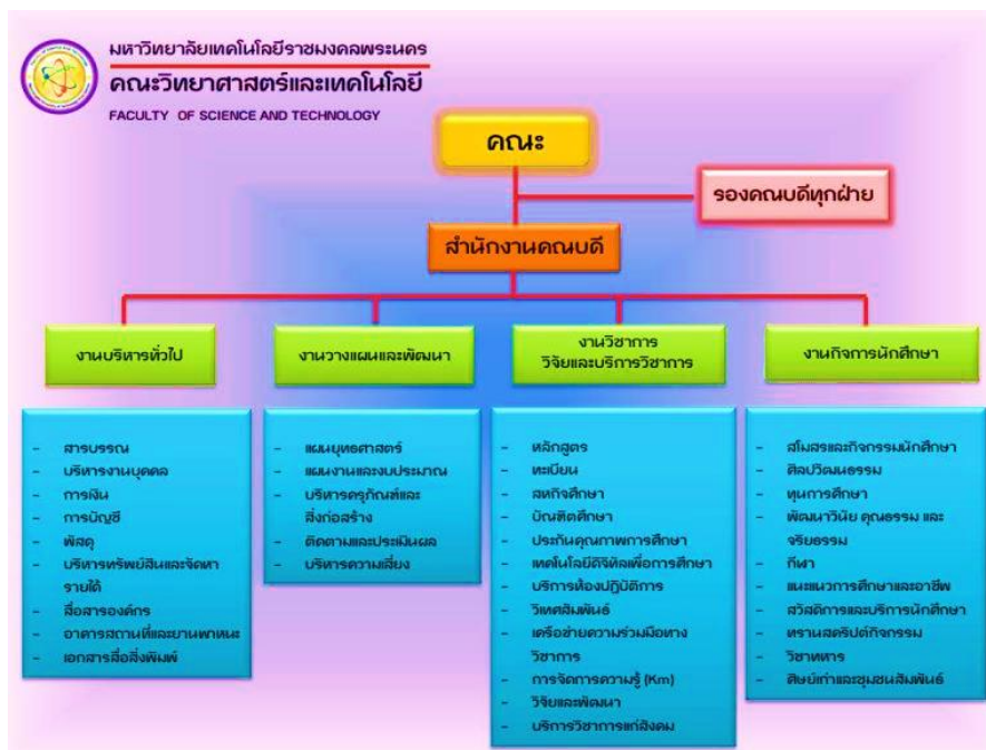
ภาพที่ 2.1 โครงสร้างการบริหารงานคณะวิทยาศาสตร์และเทคโนโลยี มหาวิทยาลัยเทคโนโลยีราชมงคลพระนคร

โครงสร้างการบริหารงานในส่วนของสายสนับสนุนของคณะวิทยาศาสตร์และเทคโนโลยี แสดงดังภาพ 2.1